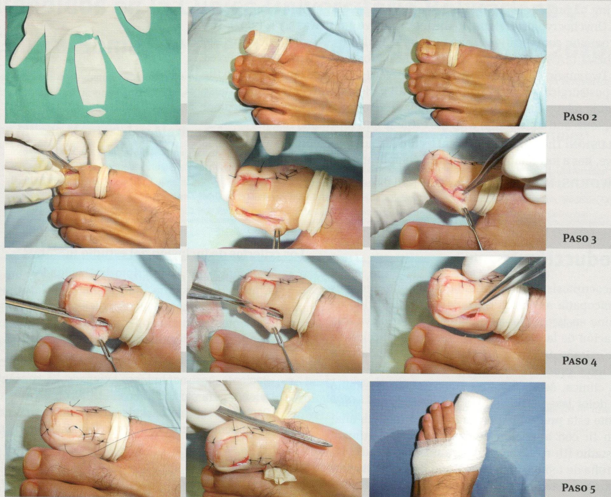
FIGURA 1. Procedimiento quirúrgico por pasos

mento de los tejidos alrededor de la uña, con pérdida de la apariencia normal del dedo), aspecto de la cicatriz (aumentada de tamaño, engrosada o elevada), espícula (crecimiento de un pedazo de uña en el sitio de la cirugía) y disestesia (cambio en la sensibilidad en el sitio quirúrgico). La satisfacción obtenida se evaluó preguntando por la conformidad con los resultados estéticos y la presencia o ausencia de sintomatología.