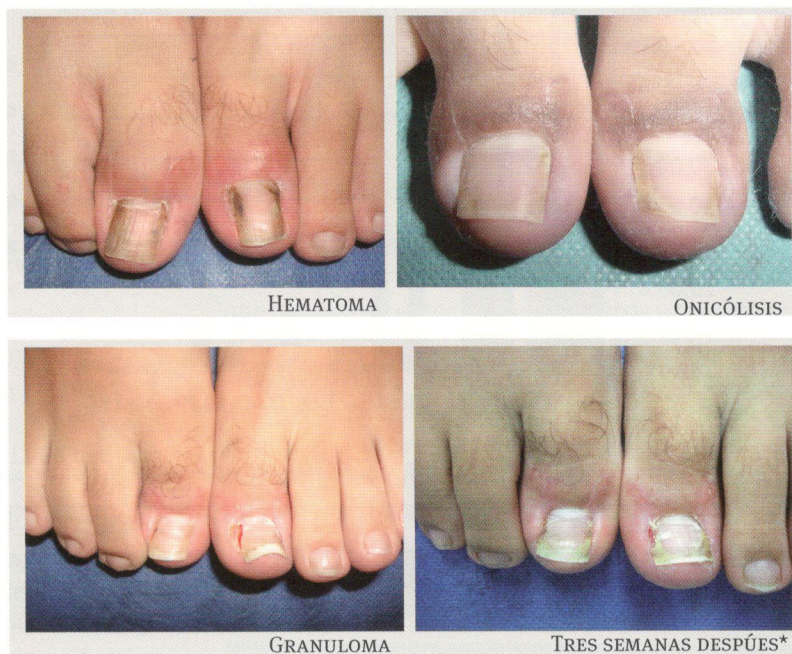
FIGURA 3. Complicaciones. * Después de aplicación de ácido tricloroacético 85 % y crioterapia.

%, respectivamente) 13 . Nuestra tasa de recaída fue de 3,3 %, un porcentaje bastante bajo comparado con los estudios mencionados.