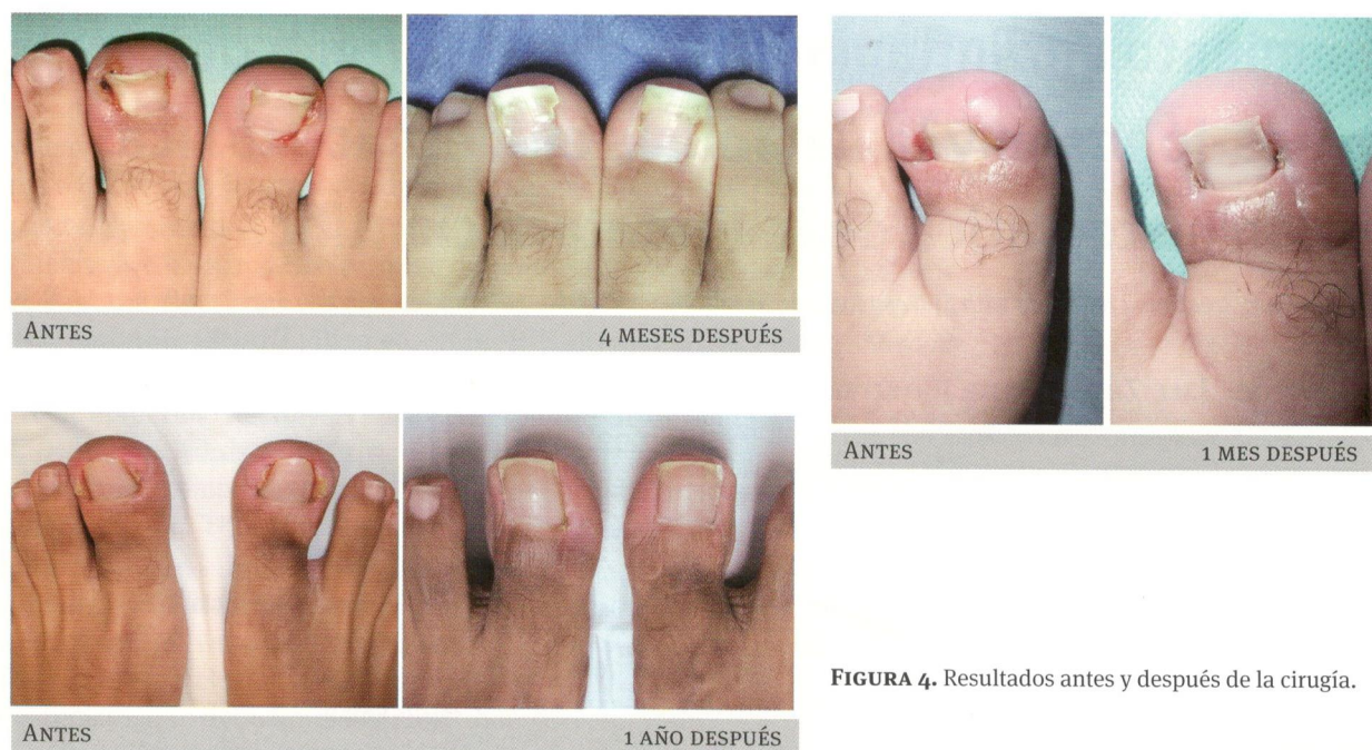
FIGURA 4. Resultados antes y después de la cirugía.