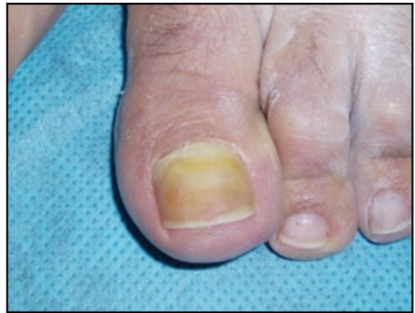
FIGURA 1. Onicomicosis proximal.

El tratamiento se hace con antifúngicos como los imidazoles. Son de elección el ketoconazol en champú, el ketoconazol en crema combinado con esteroides tópicos de baja potencia utilizados por períodos cortos, los champús de piritionato de zinc o piroctolamina, principalmente para mantenimiento y evitar recidivas, y en casos resistentes, ciclos cortos de ketoconazol oral por 7 a 10 días 13 .