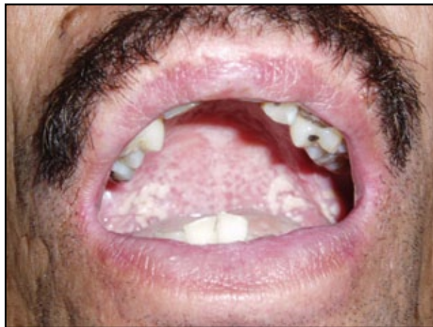
FIGURA 3. Candidiasis oral pseudomembranosa en paciente con sida.

con antibióticos y antimicóticos en pacientes con conteos bajos de linfocitos T CD4 que se encontraban en riesgo de contraer ciertas infecciones micóticas oportunistas serias, como candidiasis, pneumocistosis y otras infecciones invasivas por levaduras.