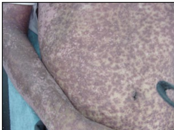
FIGURA 5. Forma purpúrica de histoplasmosis diseminada.

por H. capsulatum en pacientes con VIH/sida serán diseminadas y graves 42 .