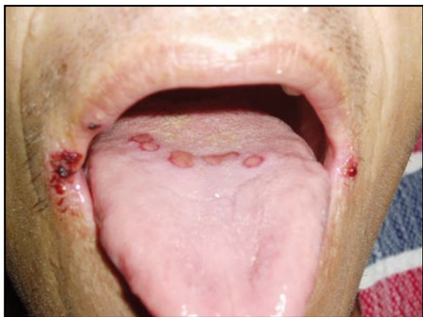
FIGURA 6. Criptococosis mucocutánea.

El tratamiento de la histoplasmosis se hace con itraconazol, aunque se ha propuesto que se puede hacer también de manera exitosa con fluconazol 45 , y se propone hacer profilaxis con itraconazol a los pacientes con conteos de CD4 menores de 100 células/ \mu l que vivan en áreas hiperendémicas, lo cual se define como más de 10 casos por 1.000 pacientes por año. Esta profilaxis puede suspenderse cuando el conteo de CD4 alcance las 200 células/ \mu l 8 . Algunos reportes hablan de tasas de mortalidad elevadas, hasta de 80% 45 . El pronóstico depende del diagnóstico y el tratamiento oportunos.